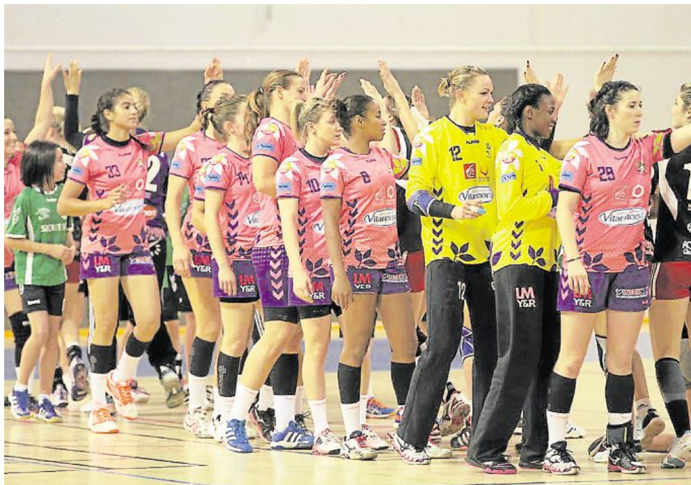
Le NLA vise désormais le maintien en Division 1.